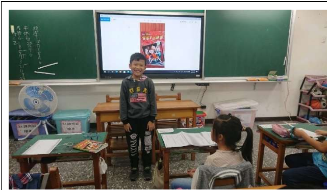
說明：學生利用發表討論有方法的策略，將與同學討論後的收穫上臺與其他人分享。