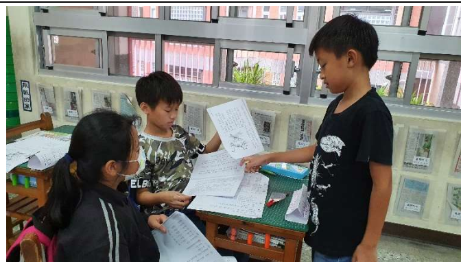
說明：學生三人一組，準備上臺發表文章接寫的內容。