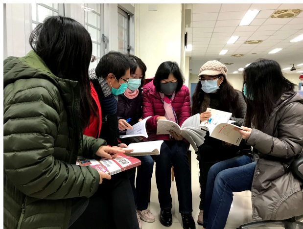
老師們就聽說讀寫有策略的內容進行討論，決定閱讀教學的重點。