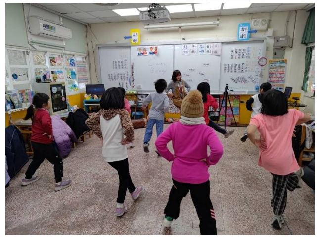
說明：教師示範並帶領學生練習泰雅族的傳統基本舞步