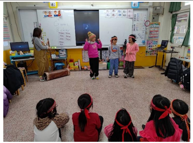
說明：學生在老師的指導下分組練習並上台演出。